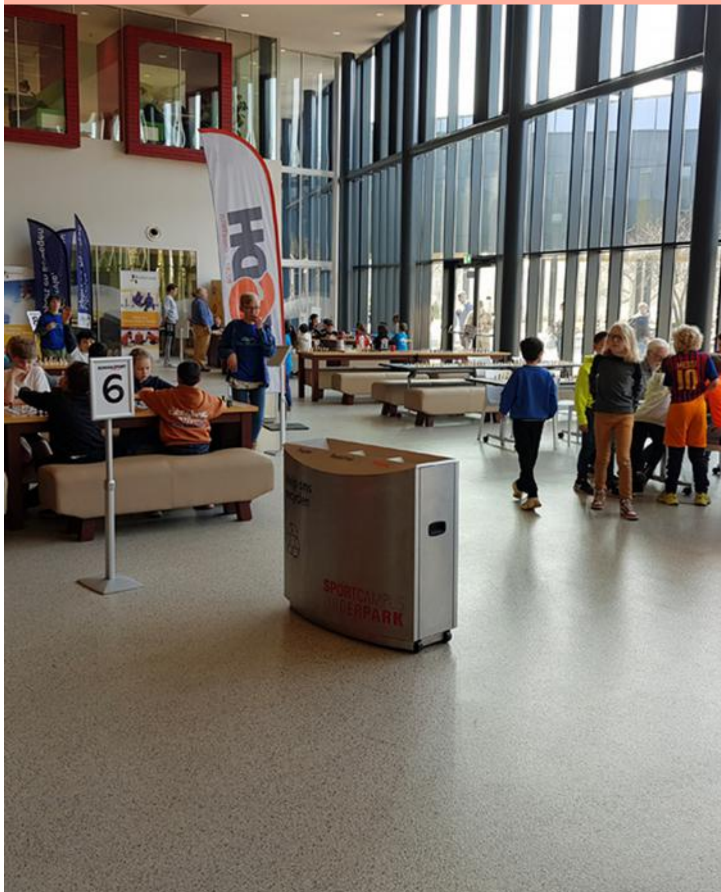
Twemaandelijks cluborgaan van Schaakcombinatie HTV