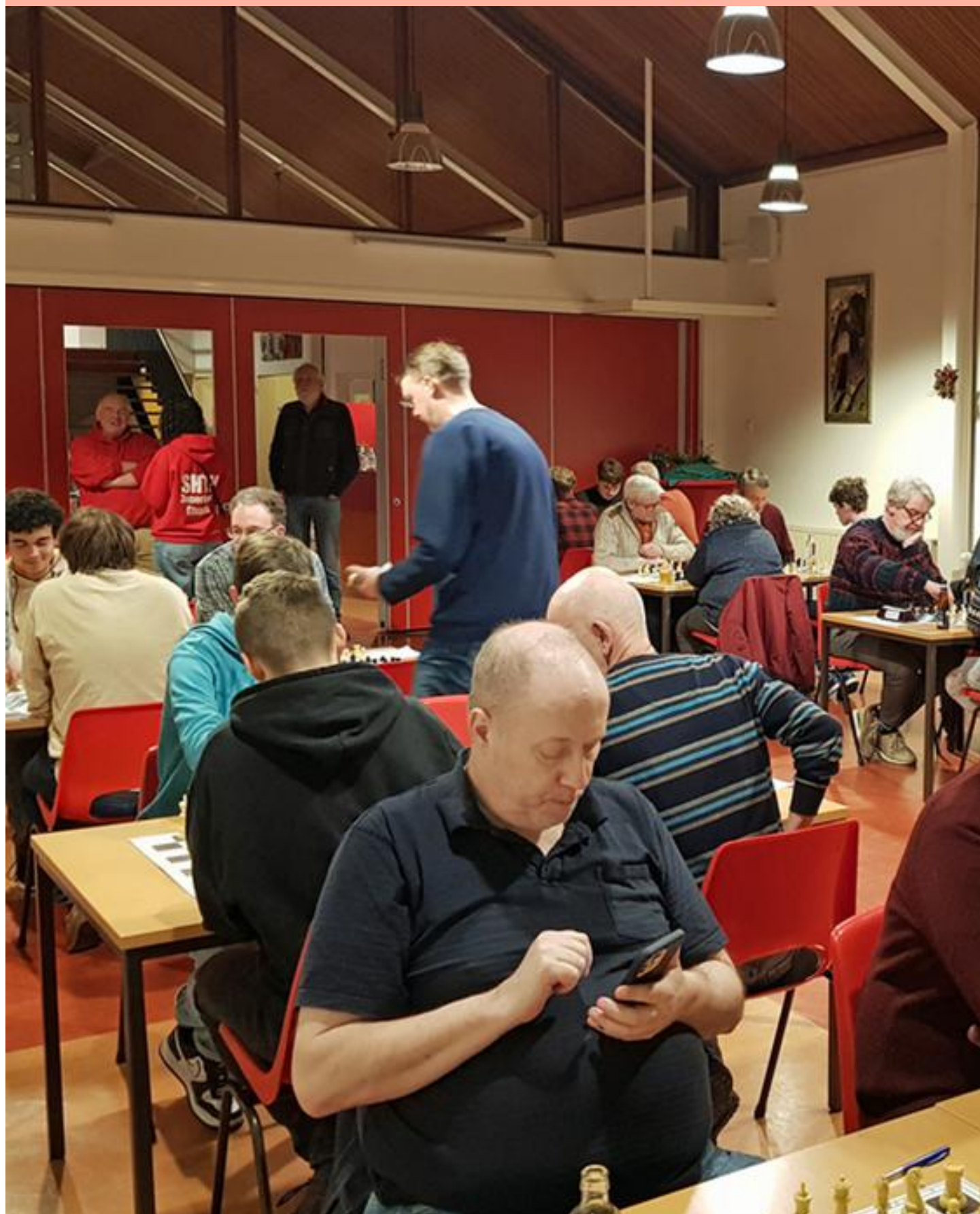
Tweemaandelijks cluborgaan van Schaakcombinatie HTV